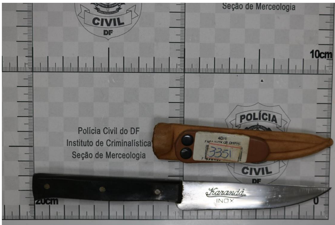
Fotografia 5 – Material examinado.