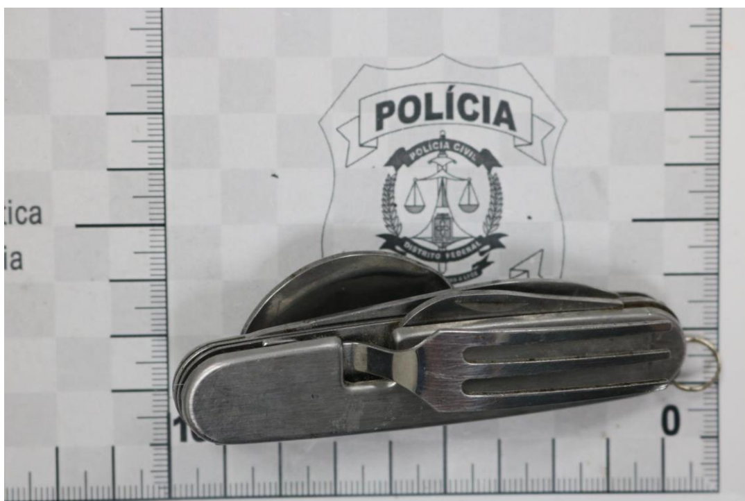
Fotografia 12 – Material examinado.