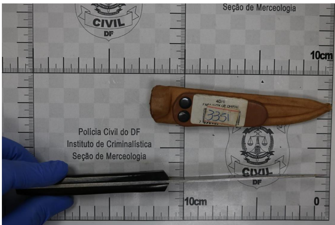
Fotografia 6 – Material examinado.