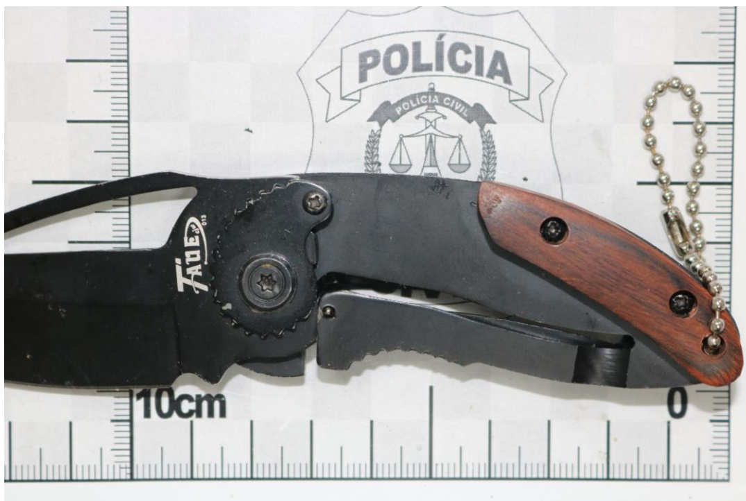
Fotografia 21 – Material examinado.