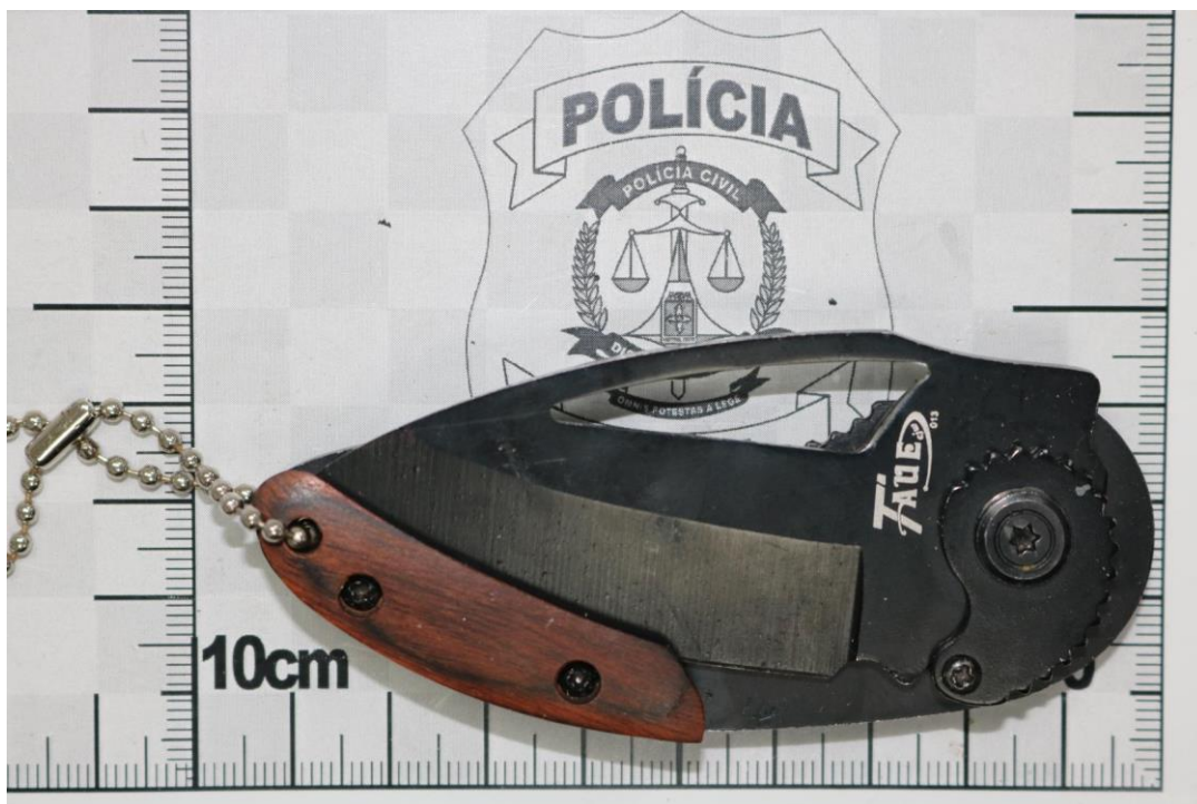
Fotografia 17 – Material examinado.