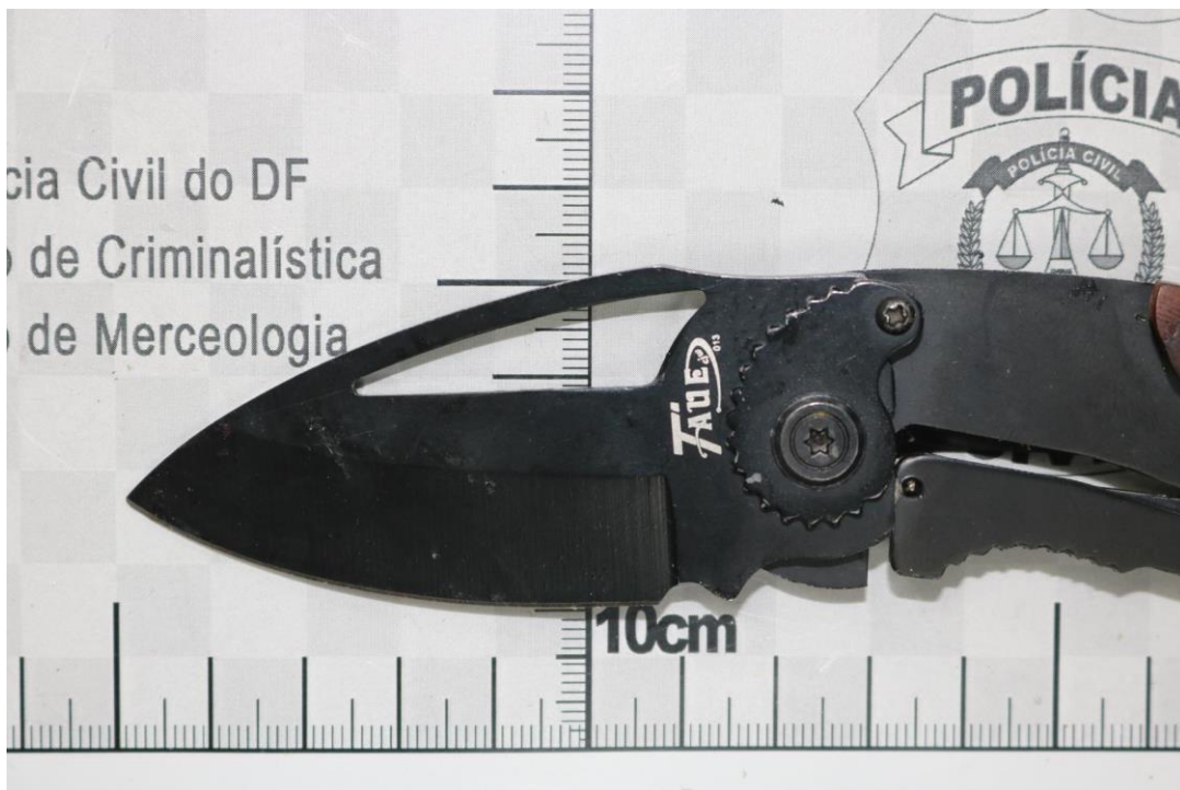
Fotografia 20 – Material examinado.