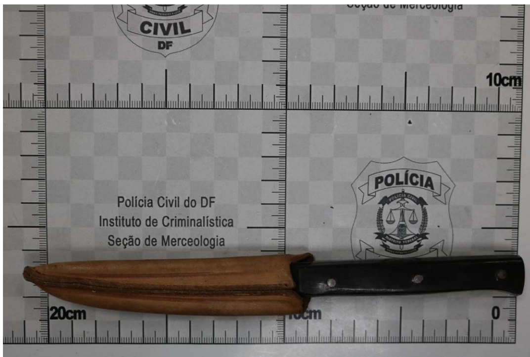
Fotografia 3 – Material examinado.