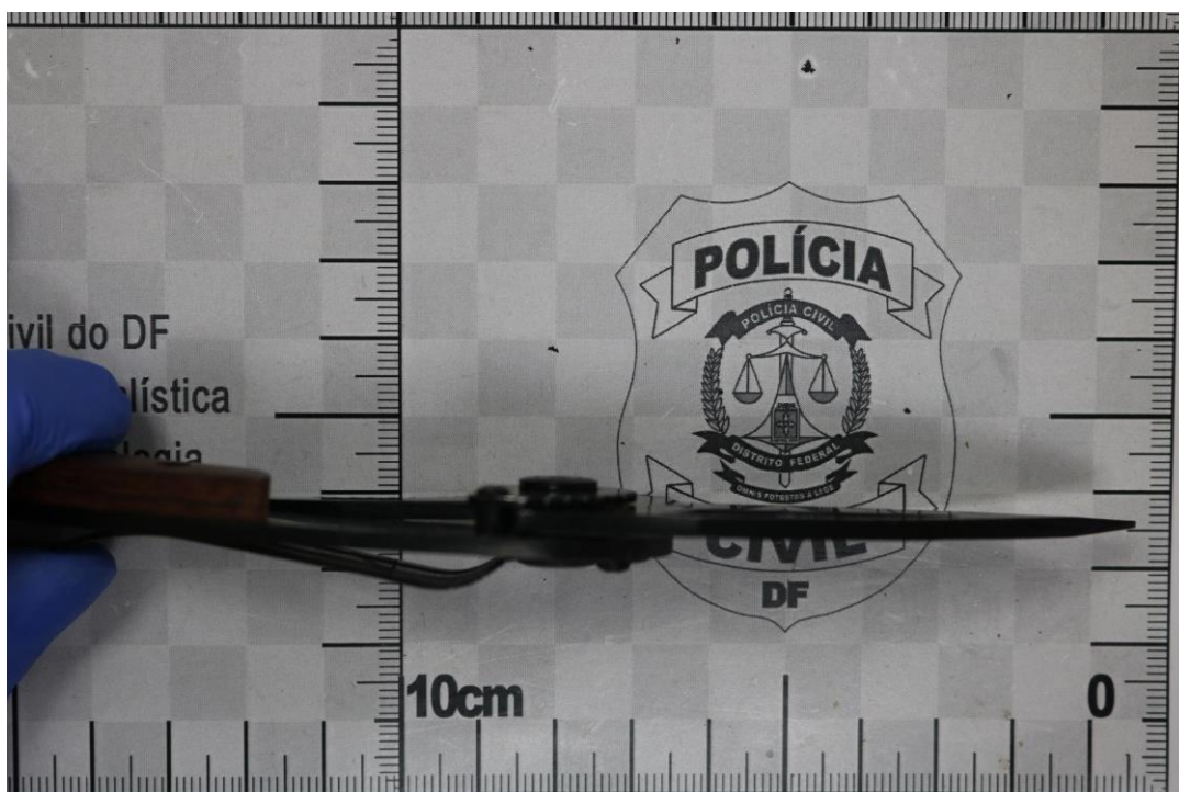
Fotografia 22 – Material examinado.