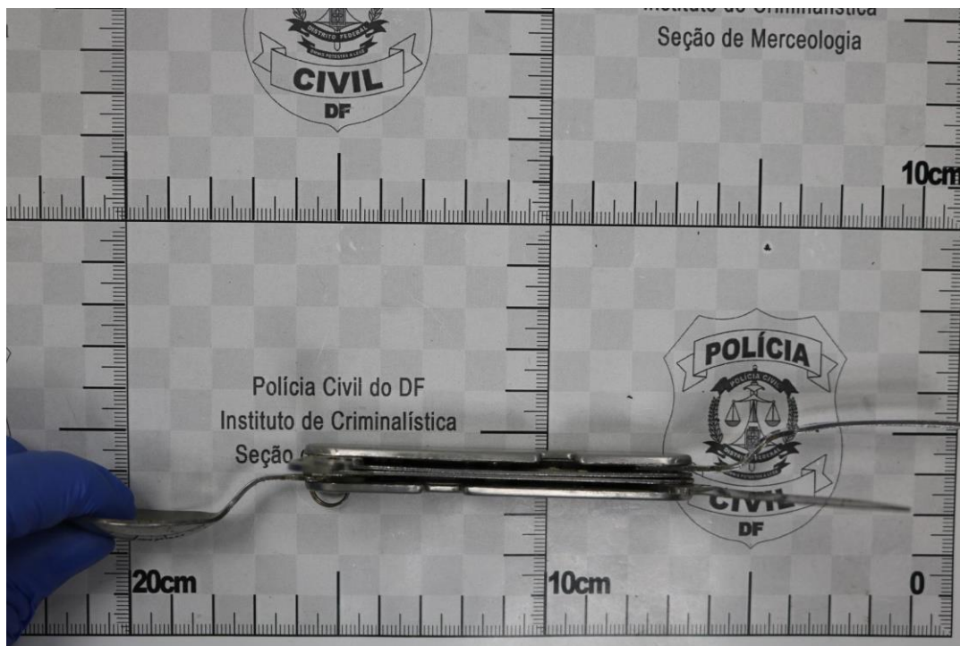
Fotografia 15 – Material examinado.