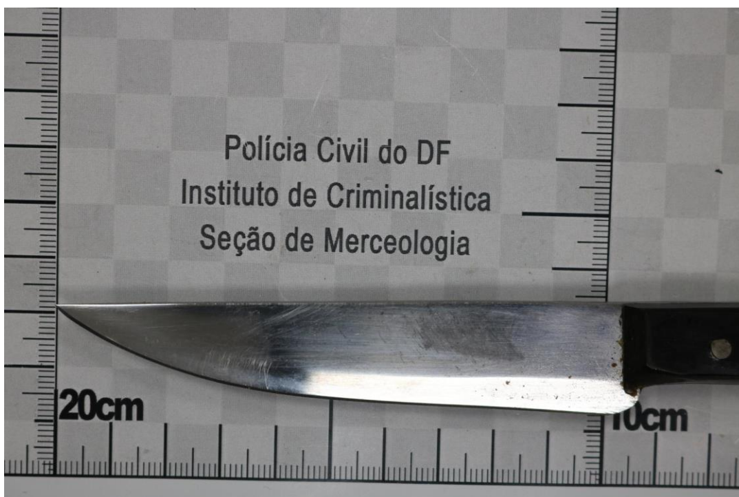
Fotografia 8 – Material examinado.