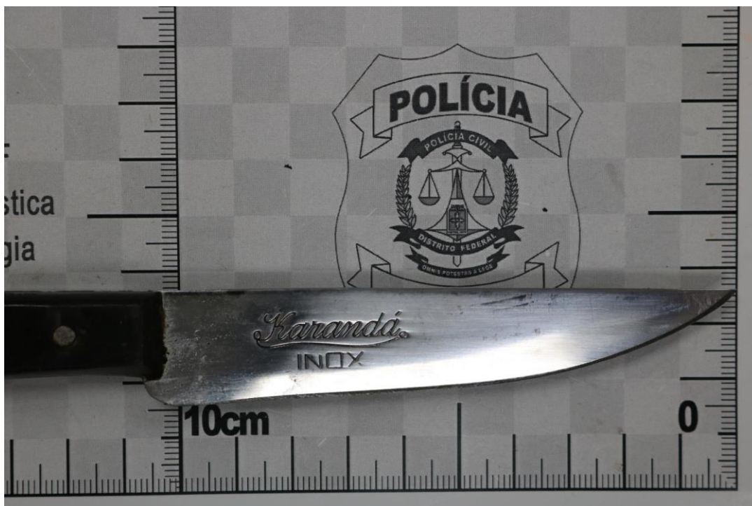
Fotografia 7 – Material examinado.