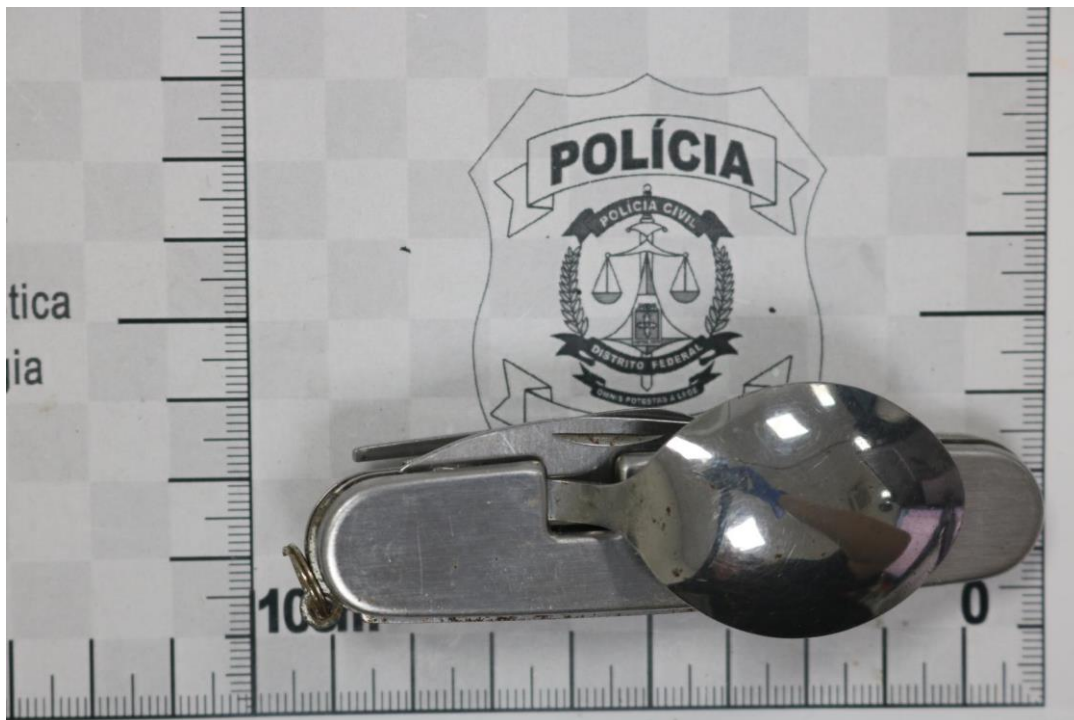
Fotografia 11 – Material examinado.