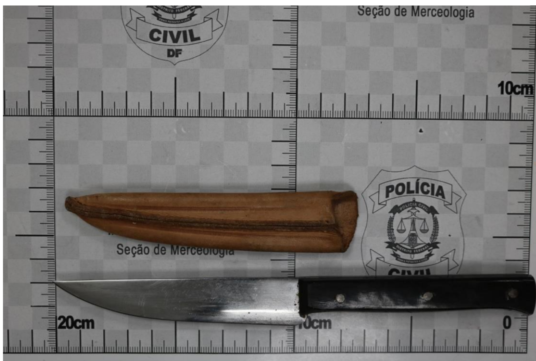
Fotografia 4 – Material examinado.