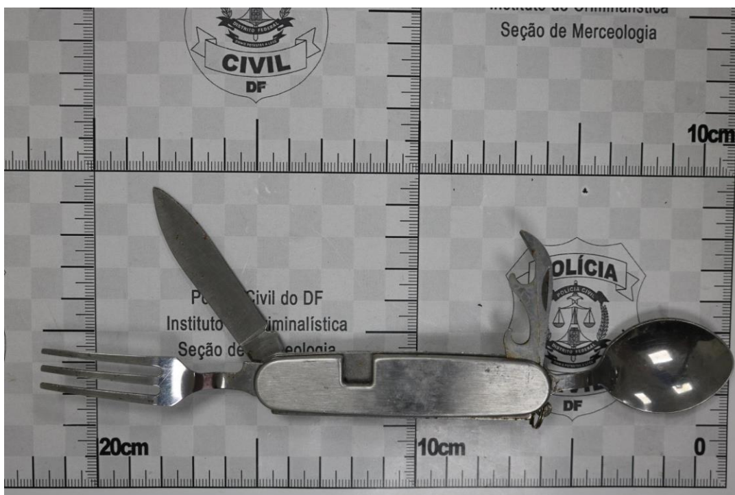
Fotografia 14 – Material examinado.