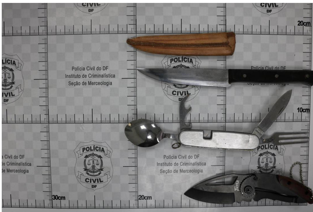
Fotografia 2 – Material examinado.