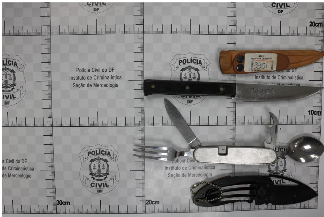
Fotografia 1 – Material examinado.