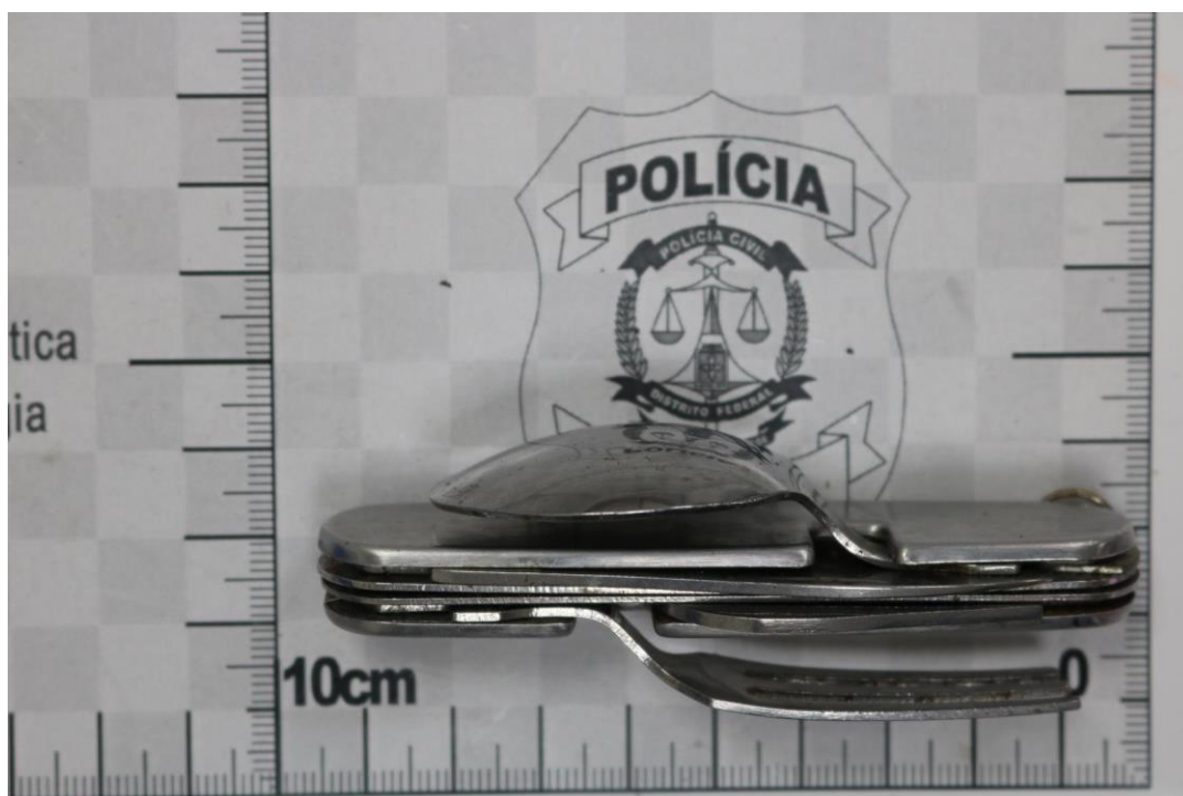
Fotografia 16 – Material examinado.