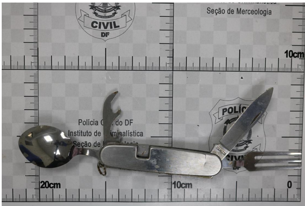
Fotografia 13 – Material examinado.