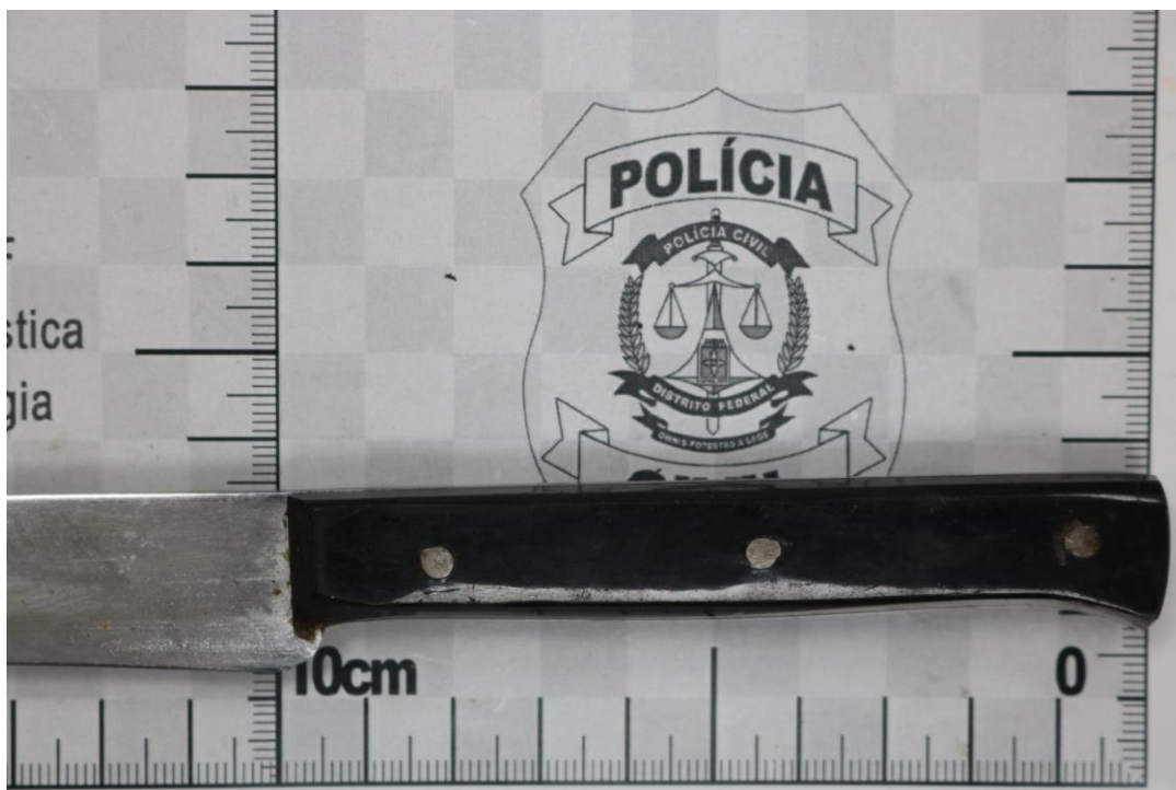
Fotografia 9 – Material examinado.