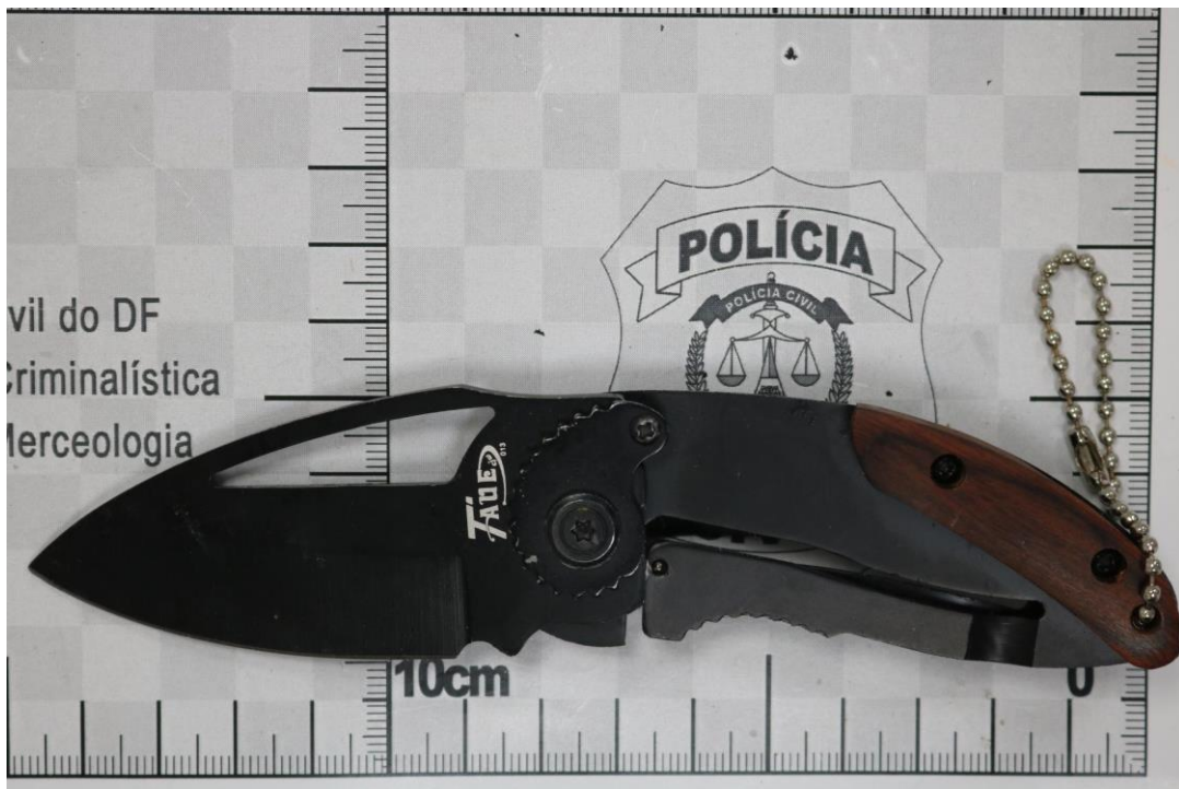
Fotografia 19 – Material examinado.