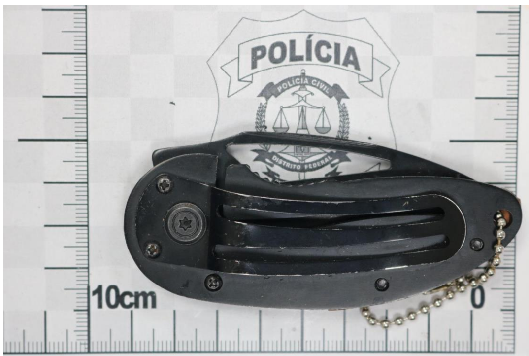
Fotografia 18 – Material examinado.